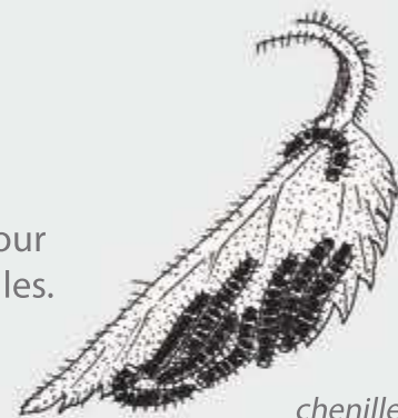
chenilles de Paon-du-jour sur une feuille d'ortie

Cela permet aux papillons de butiner les fleurs et de s'abriter. Ces plantes servent aussi de lieu de ponte pour les femelles et de source de nourriture pour les chenilles. L'ortie, par exemple, est un garde-manger pour de nombreuses chenilles.