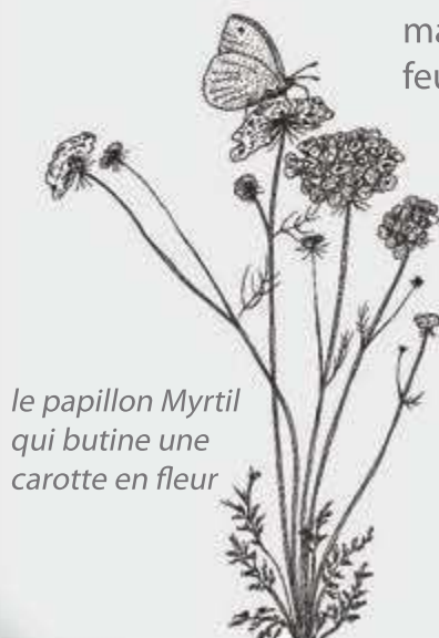
le papillon Myrtil qui butine une carotte en fleur

mangeront les feuilles de chou et celles de Machaons, les feuilles de carotte ou de fenouil.