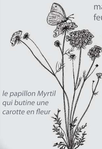
le papillon Myrtil qui butine une carotte en fleur

Les papillons viendront butiner le nectar des fleurs et les chenilles pourront se nourrir des feuilles. Par exemple, les chenilles de Piérides (du chou et de la rave) mangeront les feuilles de chou et celles de Machaons, les feuilles de carotte ou de fenouil.