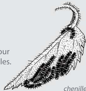
chenilles de Paon-du-jour sur une feuille d'ortie

Cela permet aux papillons de butiner les fleurs et de s'abriter. Ces plantes servent aussi de lieu de ponte pour les femelles et de source de nourriture pour les chenilles. L'ortie, par exemple, est un garde-manger pour de nombreuses chenilles.