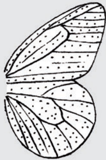
ailes de papillon

Chez certains insectes sociaux (fourmis, termites), les mâles et les femelles reproducteurs sont les seuls à posséder des ailes pour se reproduire dans les airs.