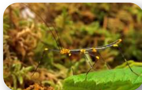
Phasme du Pérou