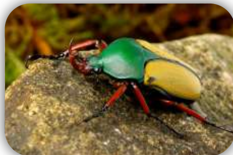
Cétoine jaune et vert