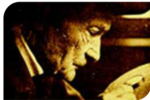
Jean-Henri FABRE, entomologiste

Jean-Henri Fabre est mort en 1915 à l'Harmas, à Sérignan-du-Comtat, dans le Vaucluse.